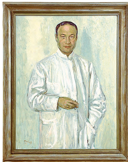
Adolf Lichtenstein, chefredaktör 1947-50.

Fotografi och målningar av Acta Paediatricas chefredaktörer alltsedan tidskriften grundades 1921.