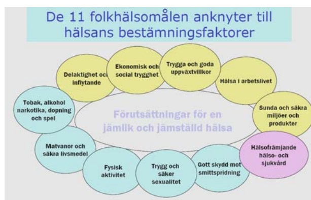
Fig. 1. De 11 folkhälsomålen

De elva folkhälsomålen (se fig. 1 [39]) har sin utgångspunkt i hälsans bestämningfaktorer där ett salutogent synsätt lyfts fram (se fig. 2 [39]). Fördelen med att utgå från bestämningfaktorer vad gäller hälsofrämjande insatser är att de blir åtkomliga för politiska initiativ och beslut.